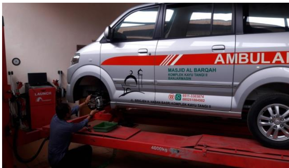
Gambar 2. Perawatan Rem Cakram

Setelah dilakukan perawatan underbody maintenance, kondisi ambulan jadi lebih baik daripada sebelumnya. Beberapa perawatan yang dilakukan juga meliputi pergantian part seperti oli dan gas nitrogen untuk ban ambulan masjid. Sehingga unit ambulan lebih siap untuk memberikan pelayanan kepada masyarakat luas. Berdasarkan tanya jawab dan pengamatan langsung selama