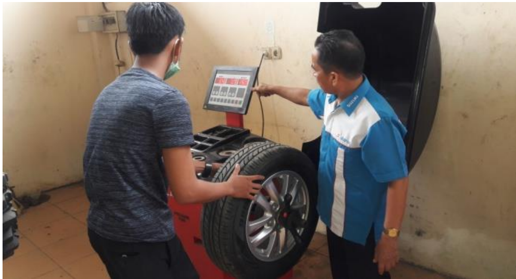
Gambar 3. Sporing dan Balancing