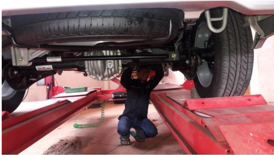
Gambar 1. Perawatan Underbody Area

Kegiatan pengabdian yang dilakukan fokus pada pemeriksaan dan perbaikan bagian bawah ambulan. Meliputi bagian bagian selang dan pipa saluran bahan bakar, selang dan pipa rem, kebocoran oli mesin, kebocoran engine coolant, suspensi depan dan belakang, suspensi depan dan arm, steering gear case, steering rack boot & tie rod end, saluran buang, oli transmisi manual.