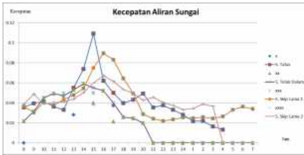
Gambar 2. Grafik Kecepatan Aliran Sungai

Dari gambar 1, mengenai grafik tinggi muka air sungai selama 24 jam, terlihat adanya rambatan pasang dan surut, dimana pasang terdalam pada saat itu terjadi sekitar pukul 16 sampai dengan pukul 22, yang kemudian disertai dengan pasang kedua dari jam 6 sampai jam 7 pagi, tetapi tidak terlalu dalam. Pengaruh pasang surut akan selalu berubah-ubah setiap harinya.