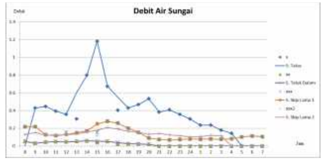
Gambar 3. Grafik Debit Air Sungai

Dari grafik dalam gambar 3, terlihat bahwa untuk Sungai Tatas menunjukkan debit yang besar, karena langsung bermuara di sungai Martapura serta panjang sungai yang dikategorikan pendek.